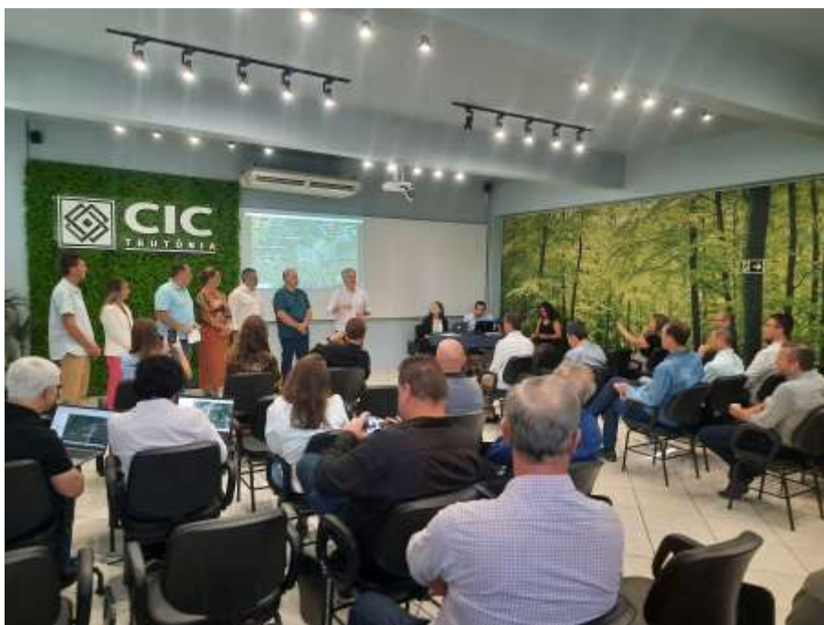
Reunião em Teutônia