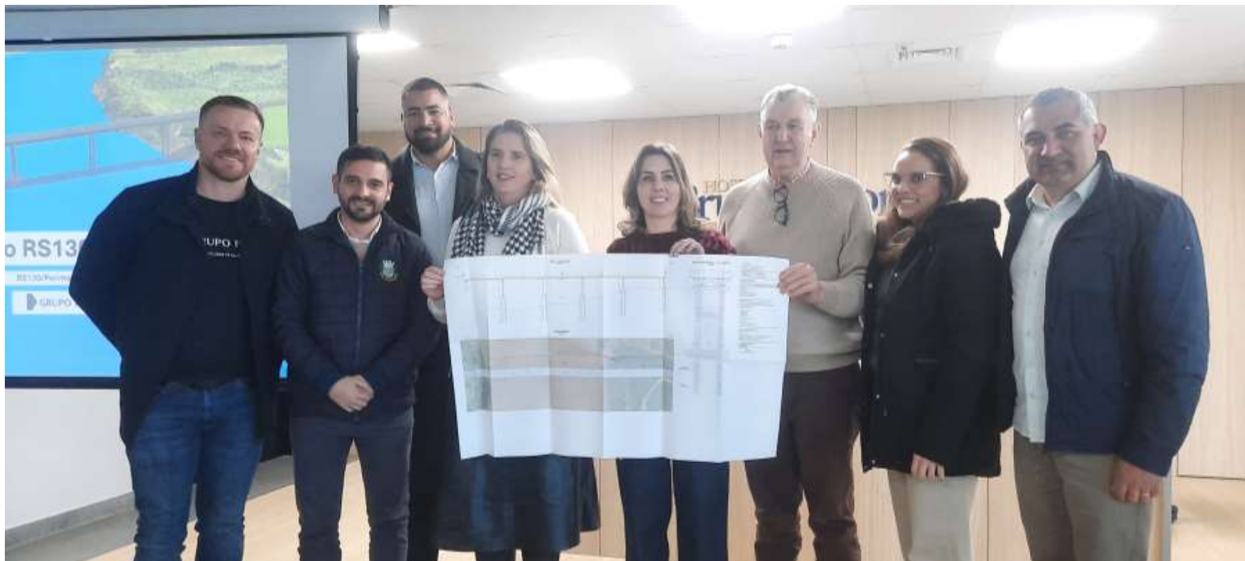
Reunião com senador Luis Carlos Heinze e apresentação de segundo projeto para construção de ponte sobre o Rio Taquari, entre Estrela/Lajeado